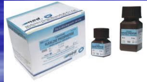
Reagentes para diagnóstico in vitro

Outros: cabelos e roupas usadas para doação internacional